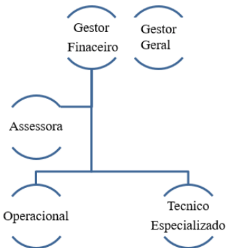
Figura 3 Organigrama

O nicho de mercado da organização é a revenda, ou seja a empresa vende para o consumidor intermediário, este funciona como elo comercial da empresa. Segundo a tabela de preços os descontos são adaptados ao tipo de vendas, bem como, à quantidade que o cliente compra. Esta é uma estratégia de negócio adotada de modo a não ser necessário um funcionário comercial interno- os descontos para o cliente, sobre a tabela, apresentam mais rentabilidade e menos custos fixos para a empresa.