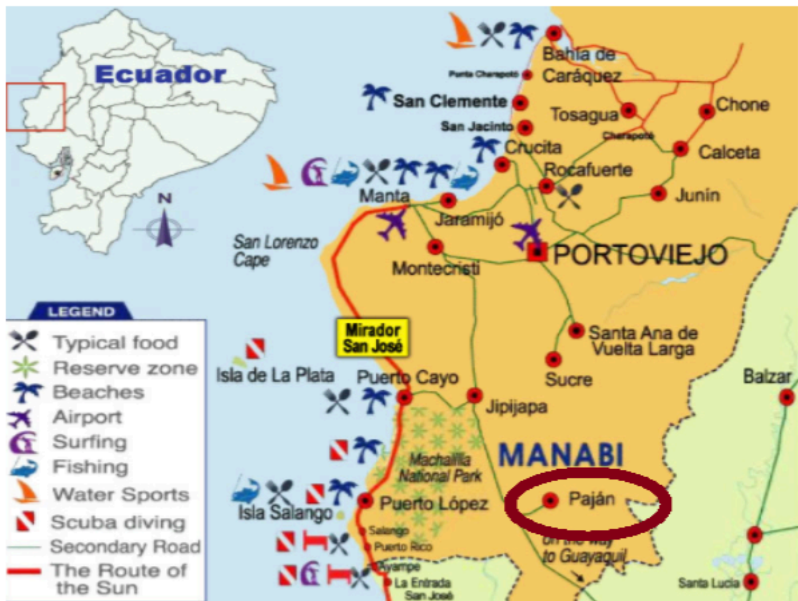
Figura 2 Mapa turístico de Manabí