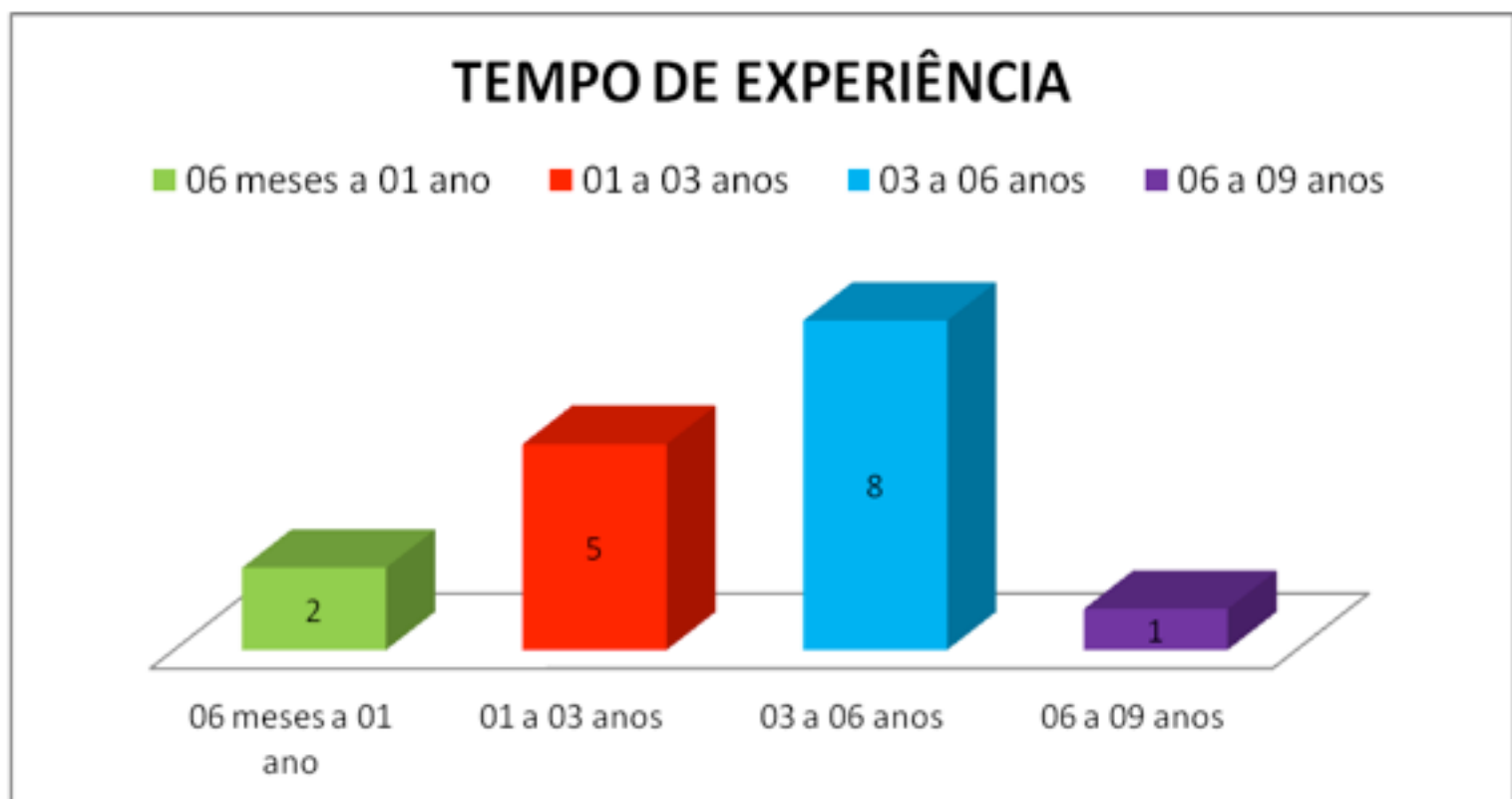
Quadro 03 Tempo de experiência das trabalhadoras no setor

Em relação ao tempo de experiência na atividade, pode-se evidenciar que 50% da amostra é composta com trabalhadoras que estão executando esta atividade entre 03 a 06 anos, 31,25% por trabalhadoras com 01 a 03 anos de experiência, 12,5% por trabalhadoras com 06 meses até um ano de experiência e 6,25% por trabalhadoras com mais de 06 anos de experiência.